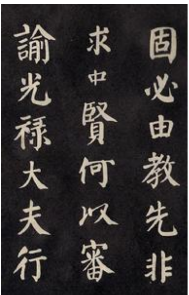
圖一、顏真卿的書法：《自書告身帖》

顏之推的長子思魯因父親教戒而繼續學習經學、文字學以及佛道，以「務先王之道」。四年後，思魯生子師古。顏師古少傳家業，遵循祖訓，傳承文字學，整理五經，成為唐代經學大家。唐太宗的軍國政務等重大詔令皆出於師古之手，名重當時，果然「紹家氏之業」，不負祖父之望。七世孫顏真卿，以甲等登進士，是中國著名的孝子忠臣，幫助朝廷平定安史之亂，更是一代書法大家（見圖一）。