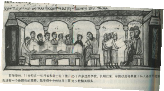
圖三、在公元十一世紀，在拜占庭王朝的一些行省和都城開辦了許多學校。帝國政府將其置於私人資金的控制下。